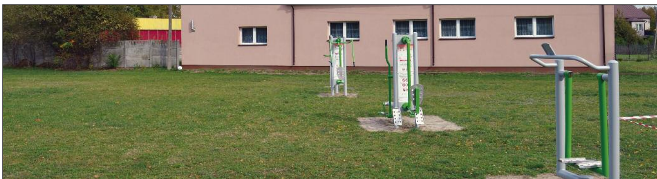
Siłownia zewnętrzna przy świetlicy w Człkówce

Inwestycja o nazwie „ Dobudowa oświetlenia ulicznego w Gminie Kołbiel ”, obejmowała dobudowę oświetlenia ulicznego w miejscowościach : Borków, Chrosna, Lubice II, Rudno i Siwianka. Wykonawca, czyli Zakład Instalacji Elektrycznych „ZALIWSKI” z siedzibą 07- 110 Grębków, ul. Ks. Jana Kukawskiego 14, wyłoniony został w postępowaniu przetargowym prowadzonym w trybie zapytania o cenę, które zostało skierowane do pięciu potencjalnych wykonawców. W terminie składania oferty złożyło dwóch wykonawców, z czego najkorzystniejszą ofertę złożył Zakład Instalacji Elektrycznych „ZALIWSKI” z siedzibą 07- 110 Grębków ul. Ks. Jana Kukawskiego 14. Realizacja dobudowy oświetlenia ulicznego nastąpiła w maju i czerwcu bieżącego roku. Wykonana została dobudowa oświetlenia ulicznego na podstawie umowy Nr 26/2019 z dnia 22 maja 2019 roku. Szczegółowy zakres inwestycji zamieszczono w BIP gminy Kołbiel w zakładce: zamówienia publiczne.