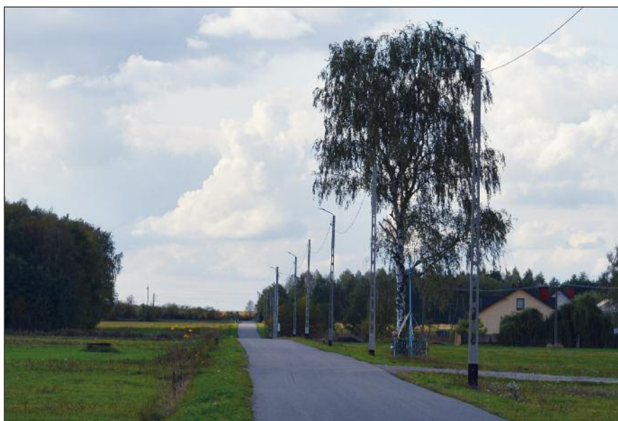
Nowa linia oświetleniowa w sołectwie Lubice II