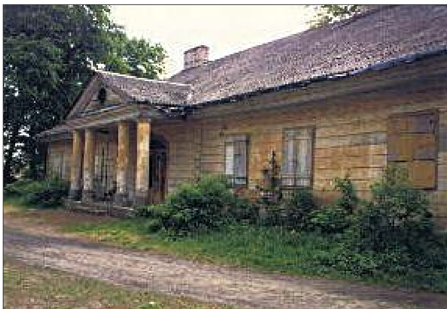
Dwór w Rudzienku (stan około 1995 r.)

Spis podatkowy z 1576 roku informuje, że Rudzienko należało do rodu Mińskich. W tym czasie nazwę wsi zapisywano jako Rudna Minor, a liczyła ona 10 włók obszaru. Mińscy herbu Rola byli szlachtą pochodzącą z powiatu brańskiego i wzięli nazwisko od majątku Mień. Mińscy nie mieli większych majątków w ziemi czerskiej i na przełomie XVI i XVII wieku sprzedali Rudzienko Machcińskim.