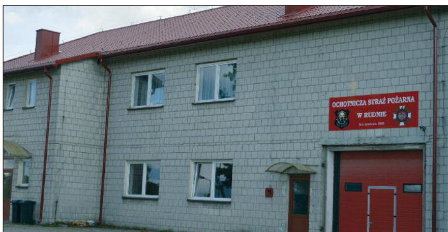
Świetlica wiejska i remiza OSP w Rudnie

Odbioru i przekazania do użytkowania dokonano w dniu 30 sierpnia 2019 roku. Szczegółowy zakres zamówienia publicznego zamieszczono w BIP gminy Kołbiel w zakładce: zamówienia publiczne.