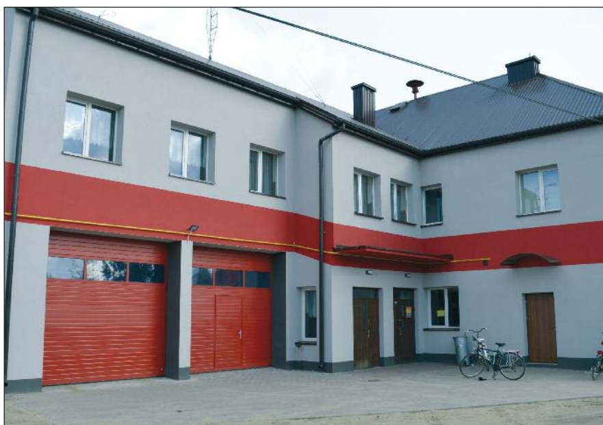
Świetlica wiejska i remiza OSP w Rudzienku

Inwestycja o nazwie „ Dobudowa oświetlenia ulicznego w Gminie Kołbiel ”, obejmowała dobudowę oświetlenia ulicznego w miejscowościach : Borków, Chrosna, Lubice II, Rudno i Siwianka. Wykonawca, czyli Zakład Instalacji Elektrycznych „ZALIWSKI” z siedzibą 07- 110 Grębków, ul. Ks. Jana Kukawskiego 14, wyłoniony został w postępowaniu przetargowym prowadzonym w trybie zapytania o cenę, które zostało skierowane do pięciu potencjalnych wykonawców. W terminie składania oferty złożyło dwóch wykonawców, z czego najkorzystniejszą ofertę złożył Zakład Instalacji Elektrycznych „ZALIWSKI” z siedzibą 07- 110 Grębków ul. Ks. Jana Kukawskiego 14. Realizacja dobudowy oświetlenia ulicznego nastąpiła w maju i czerwcu bieżącego roku. Wykonana została dobudowa oświetlenia ulicznego na podstawie umowy Nr 26/2019 z dnia 22 maja 2019 roku. Szczegółowy zakres inwestycji zamieszczono w BIP gminy Kołbiel w zakładce: zamówienia publiczne.