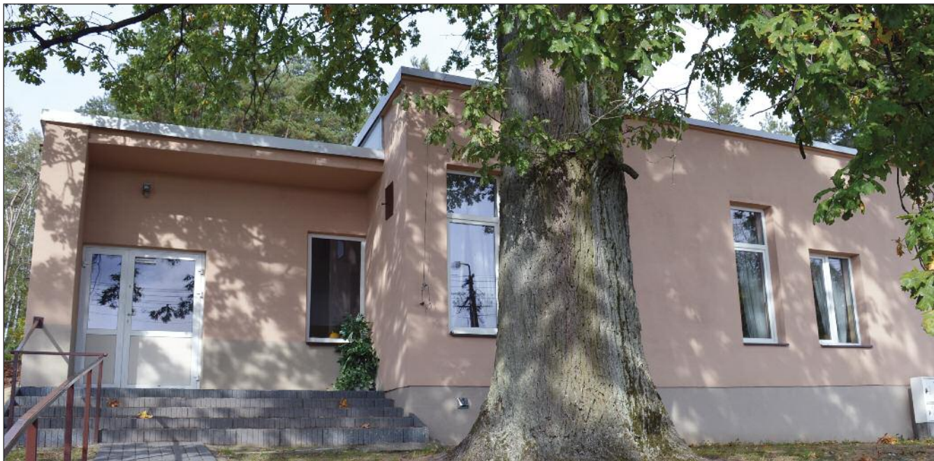
Świetlica wiejska we Władzinie

II Inwestycja o nazwie „Przebudowa Świetlic Wiejskich oraz tworzenie miejsc aktywnego wypoczynku w Gminie Kołbiel” dotyczyła przebudowy świetlic w miejscowościach: Człękówka, Rudno, Rudzienko i Władzin oraz tworzenia miejsc aktywnego wypoczynku, czyli siłowni zewnętrznych, w miejscowościach: Człękówka, Rudno oraz Władzin. Wykonawcą „REMAX Jacek Zwierz” z siedzibą Dłużew 35 A, 05-332 Siennica wyłoniono w postępowaniu przetargowym prowadzonym w trybie przetargu nieograniczonego. W przetargu na realizację zamówienia publicznego do dnia składania ofert tj. 6 marca 2019 roku do godziny 11:30 złożono dwie oferty. Najkorzystniejszą ofertę złożył „REMAX Jacek Zwierz” z siedzibą Dłużew 35 A, 05-332 Siennica. Z wyłonionym wykonawcą zawarta została w dniu 5 kwietnia 2019 roku umowa Nr 18/2019. Zakres umowy obejmował między innymi remont dachu budynku świetlicy w miejscowości Rudno, termomodernizację budynku świetlicy w miejscowości Rudzienko, termomodernizację budynku świetlicy w miejscowości Człękówka oraz prace remontowo-budowlane w budynku świetlicy w miejscowości Władzin. Ponadto wykonawca dostarczył i zamontował urządzenia fitness: